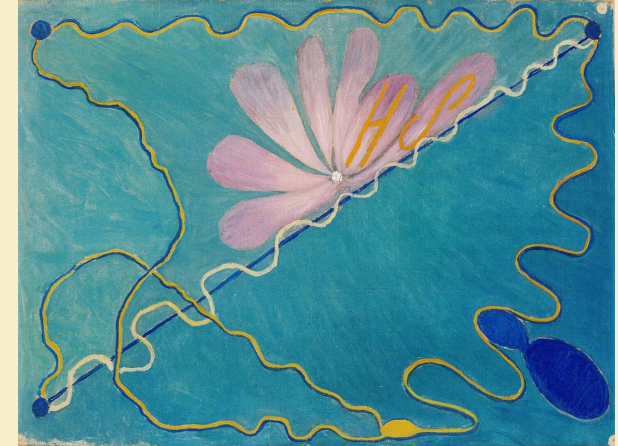
Oeuvres de Hilma af Klint